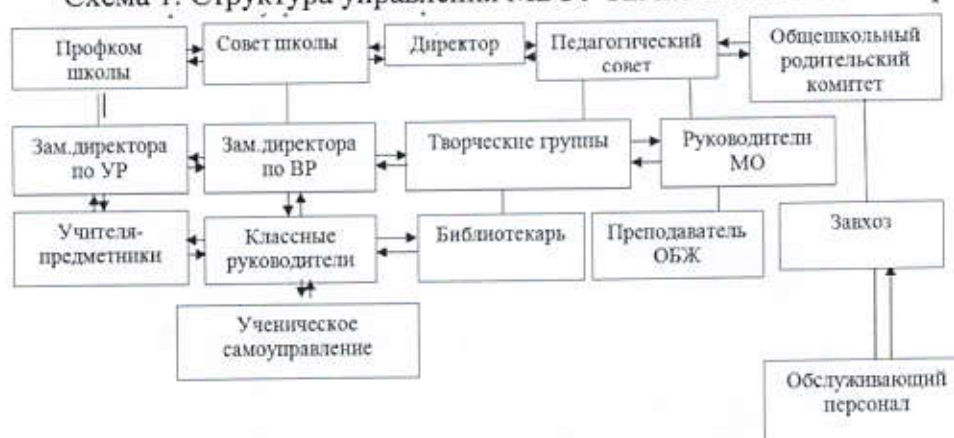
Схема 1. Структура управления МБОУ Кичкетанской СОШ Агрызского района РТ

На схеме 1 представлена четырехуровневая модель организационной структуры управляющей системы школы, работающей в режиме развития. Функции самоуправления школой возложены на совет школы. Взаимодействие структур первого уровня: профкома школы – совета школы - директора - педагогического совета и общешкольного родительского комитета школы обеспечивает демократический характер управления и гласность принятия управленческих решений.